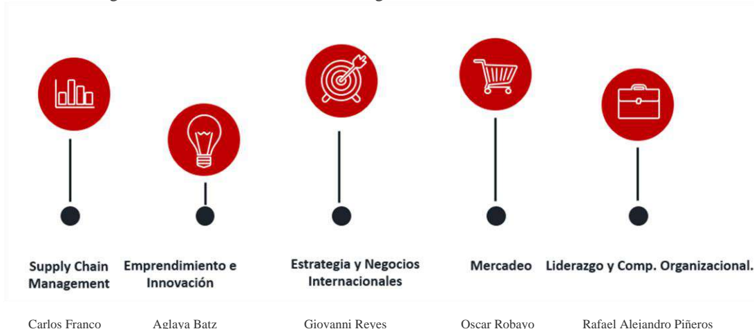
Figura 2. Directores de Líneas Investigación Escuela de Administración 2022