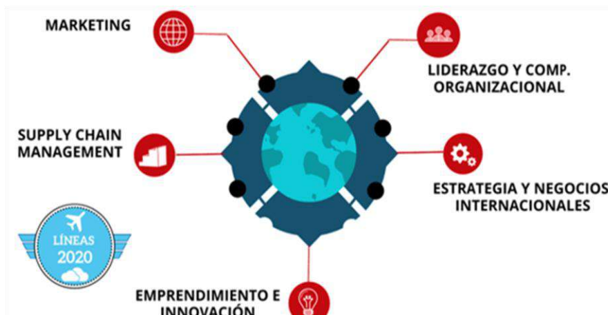
Figura 1. Líneas de Investigación Escuela de Administración 2022

En consecuencia, de lo anterior, durante el primer semestre de 2020 se definió un nuevo sistema de investigación con cinco líneas de investigación y sus respectivos directores, tal como se ilustra en las Figuras 1 y 2 y se describen posteriormente.