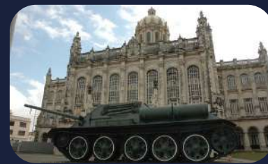
Museo de la Revolución