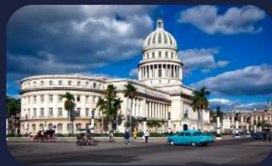
Capitolio Nacional de Cuba