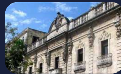
Real Academia de Ciencias Médicas, Físicas y Naturales de La Habana