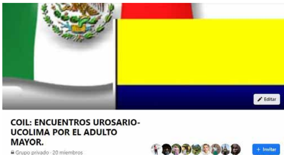
Figura 1. Grupo privado en Facebook

un grupo en Facebook cerrado, creado para dinamizar las actividades asincrónicas y mantener comunicación informal entre estudiantes y docentes (figura 1).