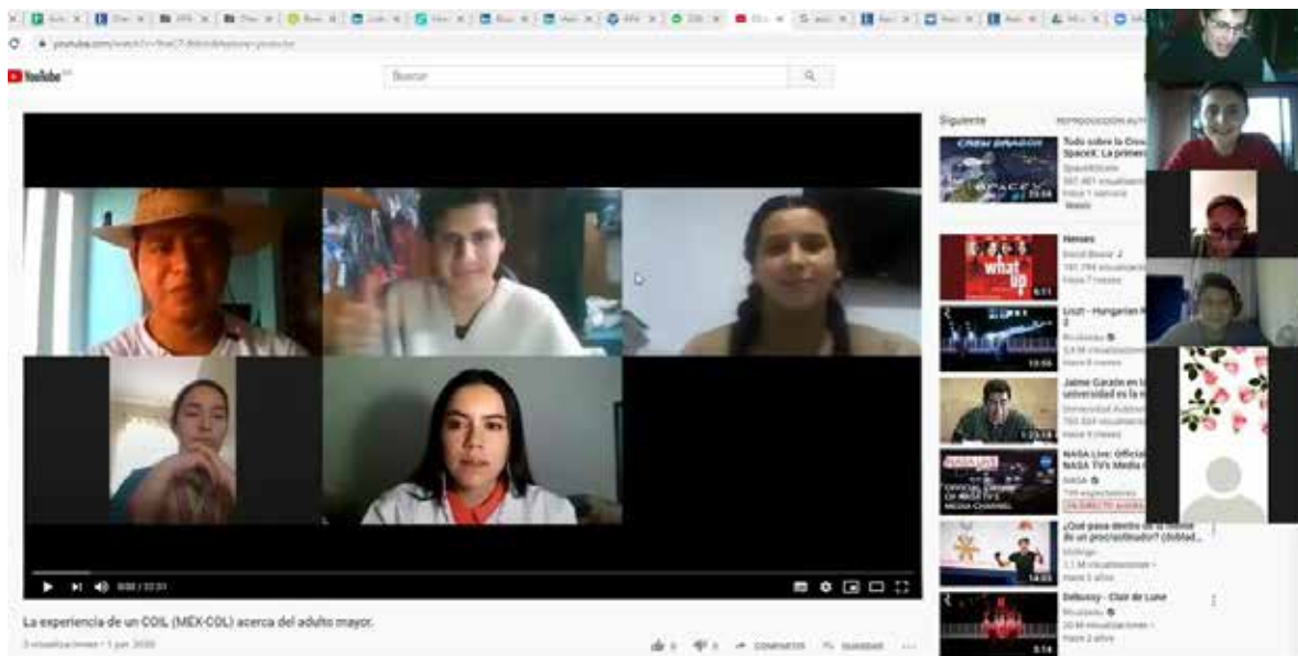
Figura 3. Sesión de cierre a cargo de los y las estudiantes