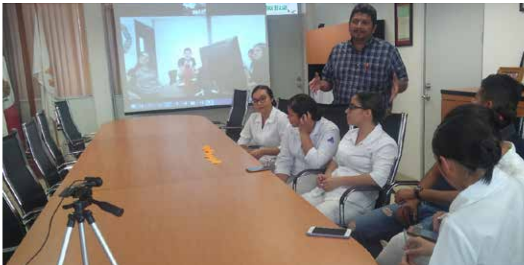
Figura 2. Tercer encuentro presencial. Registro de los colegas de la Universidad de Colima y participantes de la Universidad del Rosario, al fondo, en la pantalla

de la UCOL. Así, se acordó desarrollar los tres encuentros faltantes y un quinto encuentro para el cierre de la experiencia. De estos, se realizó un tercer encuentro presencial para marzo en la Quinta Mutis, a través de un foro de discusión sobre los aspectos culturales de la salud en Colombia y México y sus determinantes sociales, así como recursos gubernamentales disponibles para atender las necesidades de salud y rehabilitación en el adulto mayor (figura 2). Este se llevó a cabo previo al confinamiento por la pandemia por COVID-19 y posteriormente se desarrollaron en acceso remoto. Las sesiones en esta nueva modalidad mantuvieron la esencia de la planeación inicial, pero fueron complementadas con temas de interés de los y las estudiantes que surgieron del diálogo en cada una de estas. Para este acceso remoto se migró a las plataformas Collaborate y Zoom, en el horario que coincidiera para todo el grupo: las 6:00 p. m. hora de Colombia.