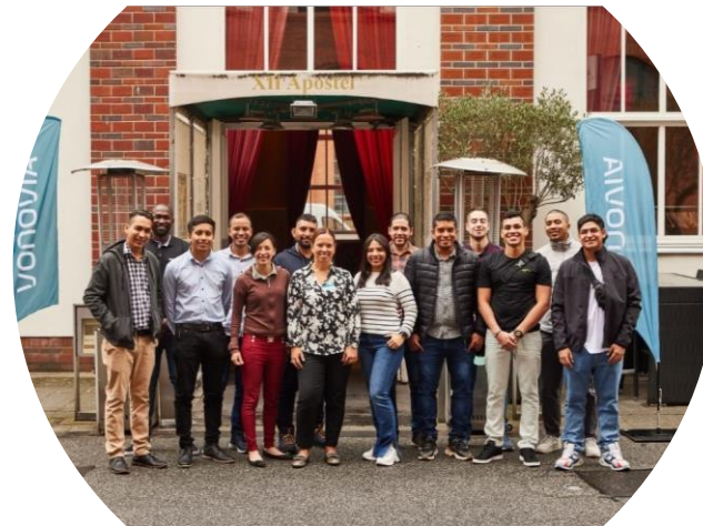
Colombianos reclutados por Vonovia.