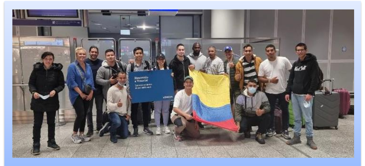
Colombianos viajando a Alemania.