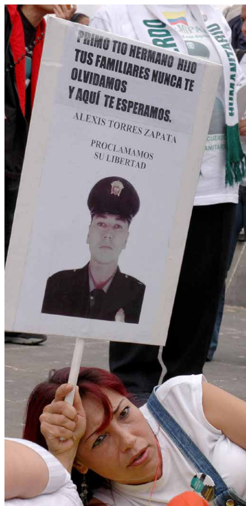
Fueron más de 400.000 las víctimas mortales del conflicto armado en Colombia entre 1986 y 2016, sin contar secuestros y desapariciones forzadas.