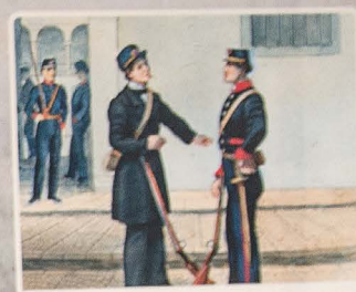
Ramón Torres Méndez. Uniformes de los batallones cívicos y alcafor, 1876.

la independencia del Rosario, recordando no era una base militar, ni una cárcel y de que debía regirse por las Constituciones que había dejado el fundador fray Cristóbal de