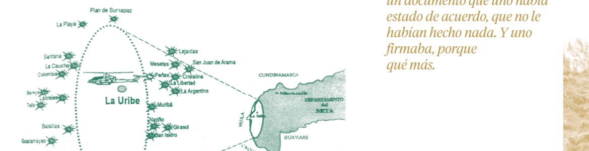
MAPA DE LA TOMA DE LA CASA VERDE. SEMAÑARZO LA VOZ, JUNIO 7 DE 1995. PÁGINA 7.

La operación militar de Casa Verde es un hecho que los habitantes del Sumapaz aún recuerdan como una de las intervenciones más violentas en su territorio. Los campesinos hablan de los helicópteros que disparaban desde el aire, las reses que eran asesinadas con el pretexto de que le pertenecían a la guerrilla y las casas incendiadas.