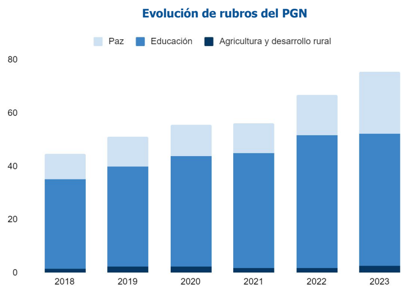
Cálculos bvc

La semana anterior, el Presidente de la República, se reunió con los coordinadores y ponentes del proyecto del Presupuesto General de la Nación (PGN) para 2023, donde se acordó buscar una adición presupuestal de $14.14 billones, con lo que el monto total del PGN sería de $405.5 billones, afirmando que lo propuesto por el gobierno anterior no tenía en cuenta algunas de las necesidades más importantes que tiene el país actualmente. De esta manera, el incremento en el PGN se destinará a agricultura, educación (infraestructura y gratuidad), salud (modelo preventivo e infraestructura) paz total, agua potable y saneamiento básico.